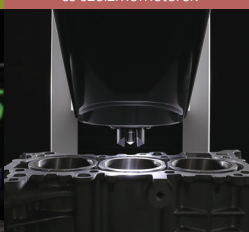
Mérőberendezés és szeizmóméterek