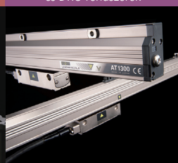
Digital Scale útmérő rendszerek és DRO rendszerek